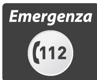
Figura 3. Esempio: Logo (versione bianco e nero).

In talune circostanze, può essere utilizzato anche nella versione in bianco e nero (Figura 3).