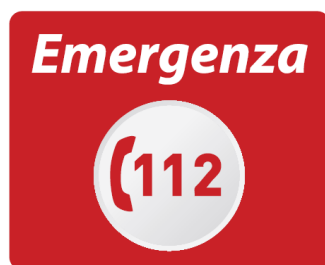
Figura 1. Esempio: Logo (versione positiva).

Il logo dovrebbe essere utilizzato in prima linea nella versione con scritta bianca su sfondo rosso.