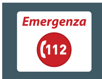
Figura 2. Esempio: Logo (versione negativa) su superficie scura.

Per aumentarne la visibilità su superfici scure (come per esempio su superfici rosse o blu), è comunque opportuno utilizzarlo in versione negativa, scritta rossa su sfondo bianco e cerchio rosso con stilema e "112" bianchi (Figura 2).